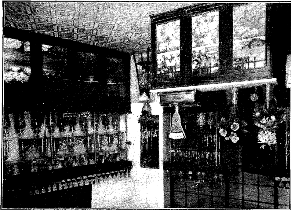
Interior de la Confitería y Pastelería LA TOLEDANA