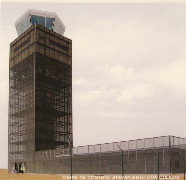
TORRE DE CONTROL AEROPUERTO DON QUIJOTE