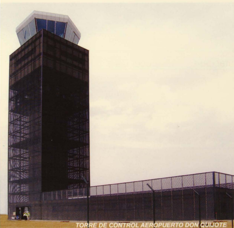
TORRE DE CONTROL AEROPUERTO DON QUIJOTE