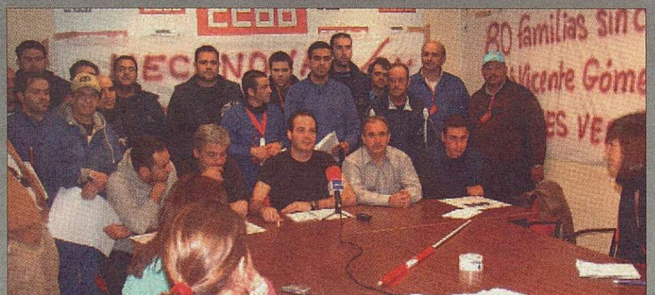
Trabajadores de Mecnova reunidos en CCOO para analizar el Expediente de Regulación de Empleo presentado por la empresa

Otro enorme frente de trabajo, este más de defensa puramente jurídica, es la constante sangría de despidos individuales de trabajadores, que a diario acuden a nuestros abogados, y que en la mayoría de los casos se logra demostrar que se trata de despidos improcedentes, consiguiendo así las máximas indemnizaciones.