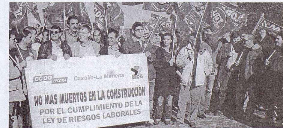
Concentración de delegados de construcción y madera frente a la sede de los empresarios en Toledo

Es cierto que seguimos creciendo... - comenzábamos el año con 16.128 afiliados/as y vamos a finalizarlo con 18.000 afiliados/as.