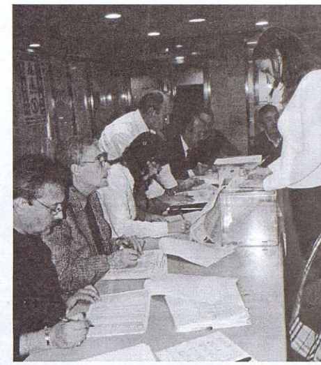
Elecciones sindicales en la sede de Caja Castilla La Mancha en Toledo

Incorporar también las materias de salud y seguridad en el trabajo que aún no estén recogidas, así como tener en cuenta, a la hora de las subidas, que los salarios en nuestra provincia se encuentran unos 2000 euros/año por debajo de la media de los Convenios a nivel nacional, y ni que decir tiene que, a pesar de que la inflación parece que tiende a remitir, es imprescindible seguir recogiendo las cláusulas de revisión salarial.