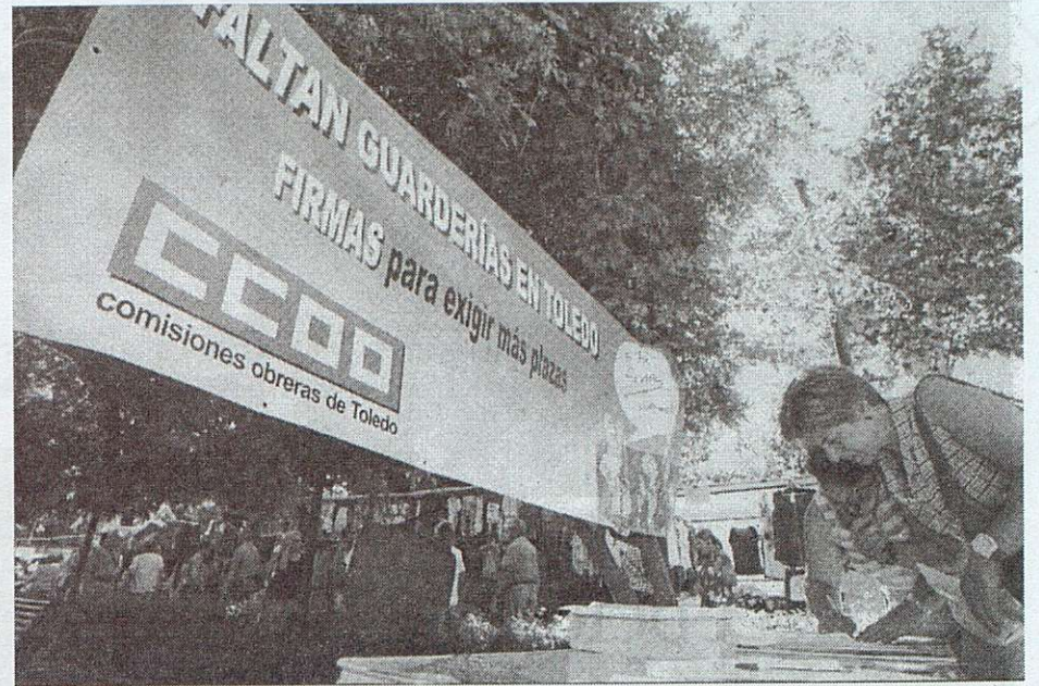
En la campaña se recogieron miles de firmas

CC.OO. valora positivamente la respuesta de la Consejería de Bienestar Social y de los alcaldes de Toledo y Talavera a este problema, considerando que las inversiones sociales, además de contener un sentido de atención al ciudadano y de justicia retributiva, aportan un importante componente añadido de creación de empleo.