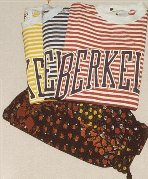
Camisetas rayas muchos dibujos 100% algodón.... 1.595 ptas. Bañadores..... 2.250 ptas.