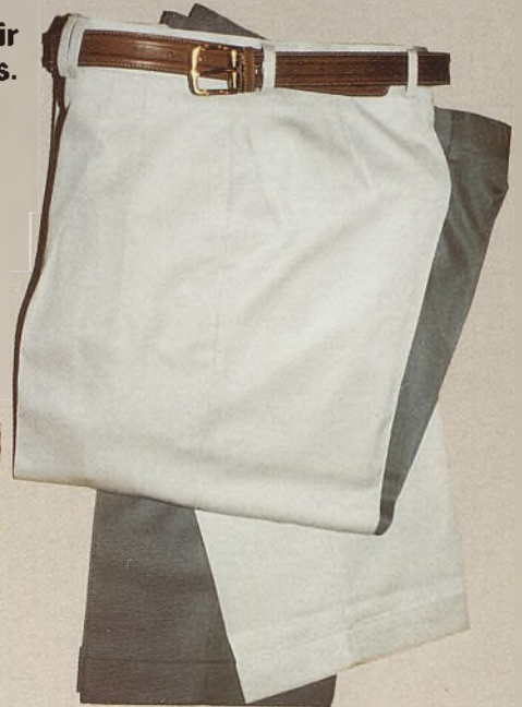
Pantalón vestir 4.995 ptas.