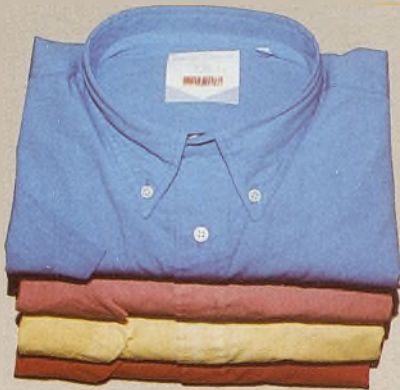
Camisa algodón 3.000 ptas.