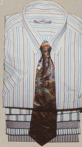
Camisa algodón 100% 2.250 ptas.