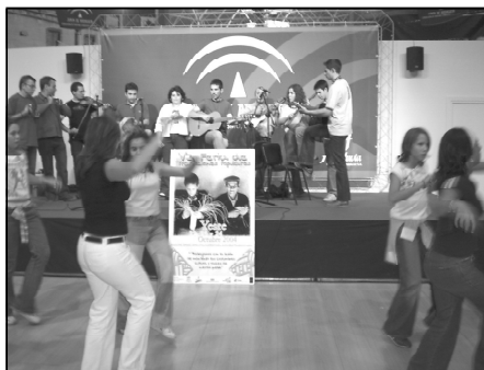
El Grupo Aire Serrano durante su actuación

Si siguiendo la línea del Ayuntamiento de su apuesta por el turismo, Yeste ha asistido a la Feria de Turismo "Tierra Adentro" celebrada en Jaén del 30 de septiembre al 3 de octubre. Una de las ferias turísticas de interior más importantes de España tanto por su afluencia de visitantes como de profesionales.