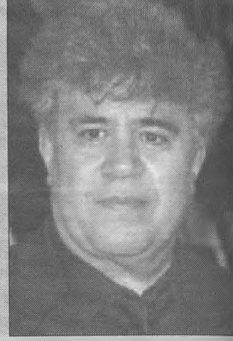
Pedro Almodóvar, cineasta castellano-mancheo

Que no está la economía para tantas llaves.