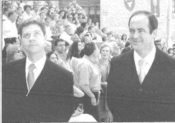
Emiliano García-Page, consejero de Relaciones Institucionales y José Bono, ministro de Defensa, durante una procesión del Corpus.

Después, Carretero dejó de hablar y se hizo el silencio. Evidente.