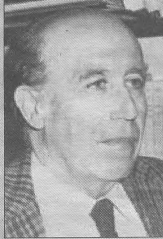
Francisco García Pavón, escritor tomellosero