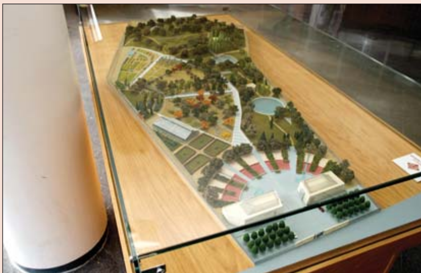
Jardín Botánico de Albacete que se encuentra en fase de construcción. Foto: Maqueta.

En Albacete se construirá un nuevo edificio polivalente , con una inversión de 7,5 millones de euros, que se destinará a usos múltiples y en el que se ubicarán aulas, seminarios y despachos; se ampliará el Instituto de Investigación del Jardín Botánico , el Aula Magna del edificio Melchor de Macanaz , además de otras actuaciones menores.