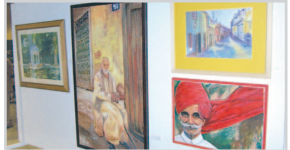
Un aspecto de la exposición.

'Once de nosotras' es el nombre de guerra de la muestra que hasta el 30 de marzo poblará las paredes de la Fábrica de Harinas. Organizada con motivo del Día Internacional de la Mujer, la exposición recoge las obras de varias de las componentes del Grupo de Mujeres Pintoras y Escultoras