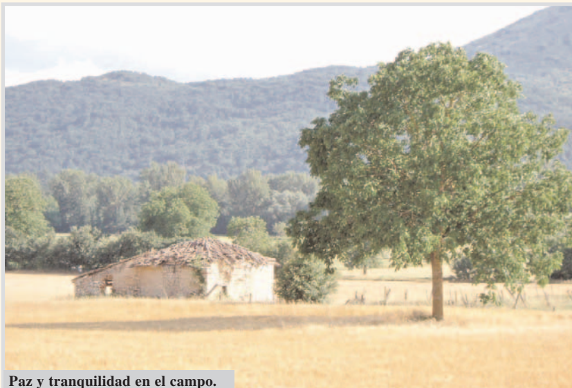
Paz y tranquilidad en el campo.

Ciertamente, como ha cantado en sus versos Horacio, Fray Luis de León y otros insignes poetas, la paz y tranquilidad del campo nos da esa oportunidad de observar cosas en las que nunca habíamos reparado. Basta para experimentar ese sosiego darse un paseo por algún camino rural o a través de la montaña. ¡Cuántas plantas minúsculas, flores, piedras, etc., nos invitan a recrear nuestra mirada!.