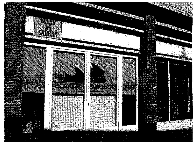
Esta puerta lateral es la que los cacos reventaron sirviéndose del sistema del "alunizaje".

por los ruidos no pudieron consumar su asalto.