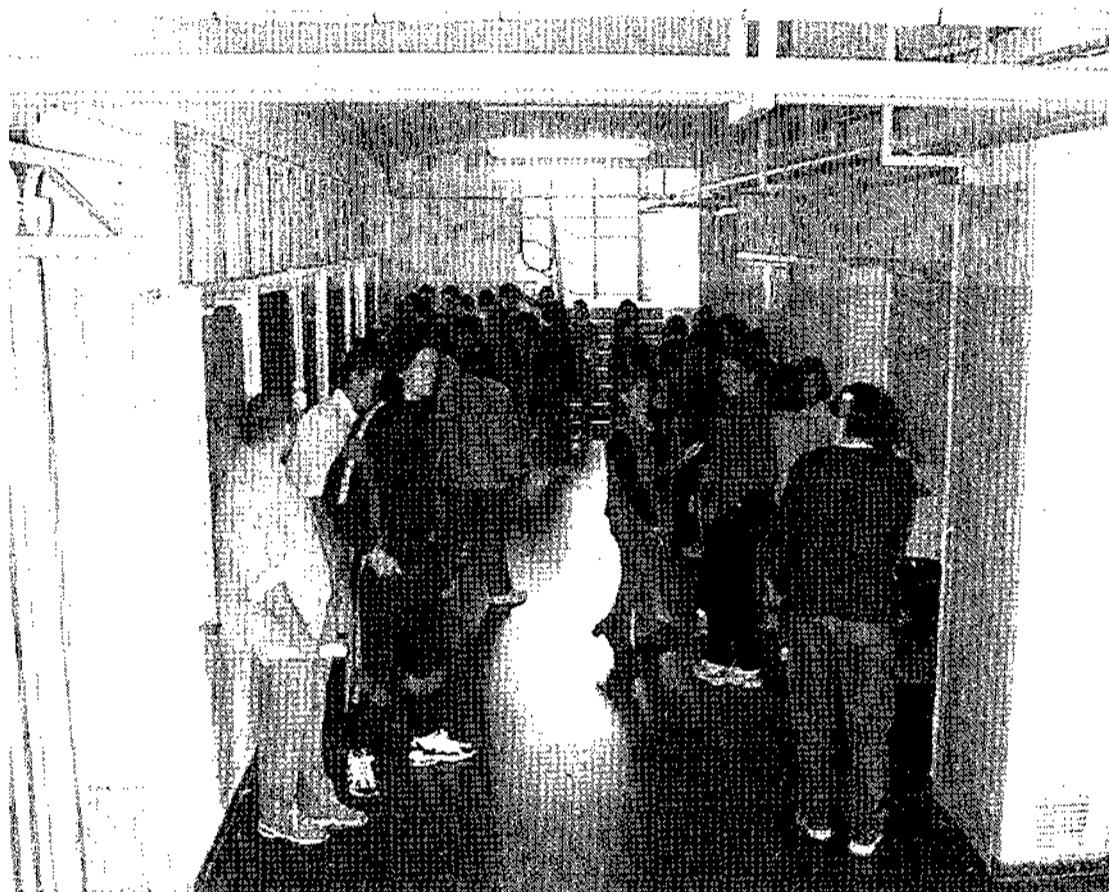
Entre la comunidad escolar hay preocupación dado el número de alumnos y la situación de los edificios.

Además, las AMPAS denuncian la "difícil convivencia entre los propios alumnos, como consecuencia de la diferencia de edad existente". Entre las denuncias además se encuentra el bajo rendimiento escolar como consecuencia, las Juntas directivas, decidieron en principio poner en co-