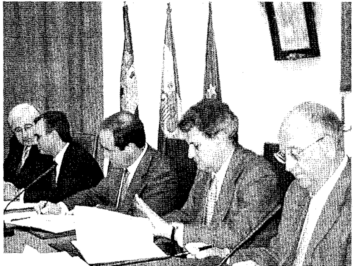
La firma de un protocolo regional permitirá abrir ventanillas únicas en todas las provincias

Pero además, las 5 Cámaras de la región han presentado