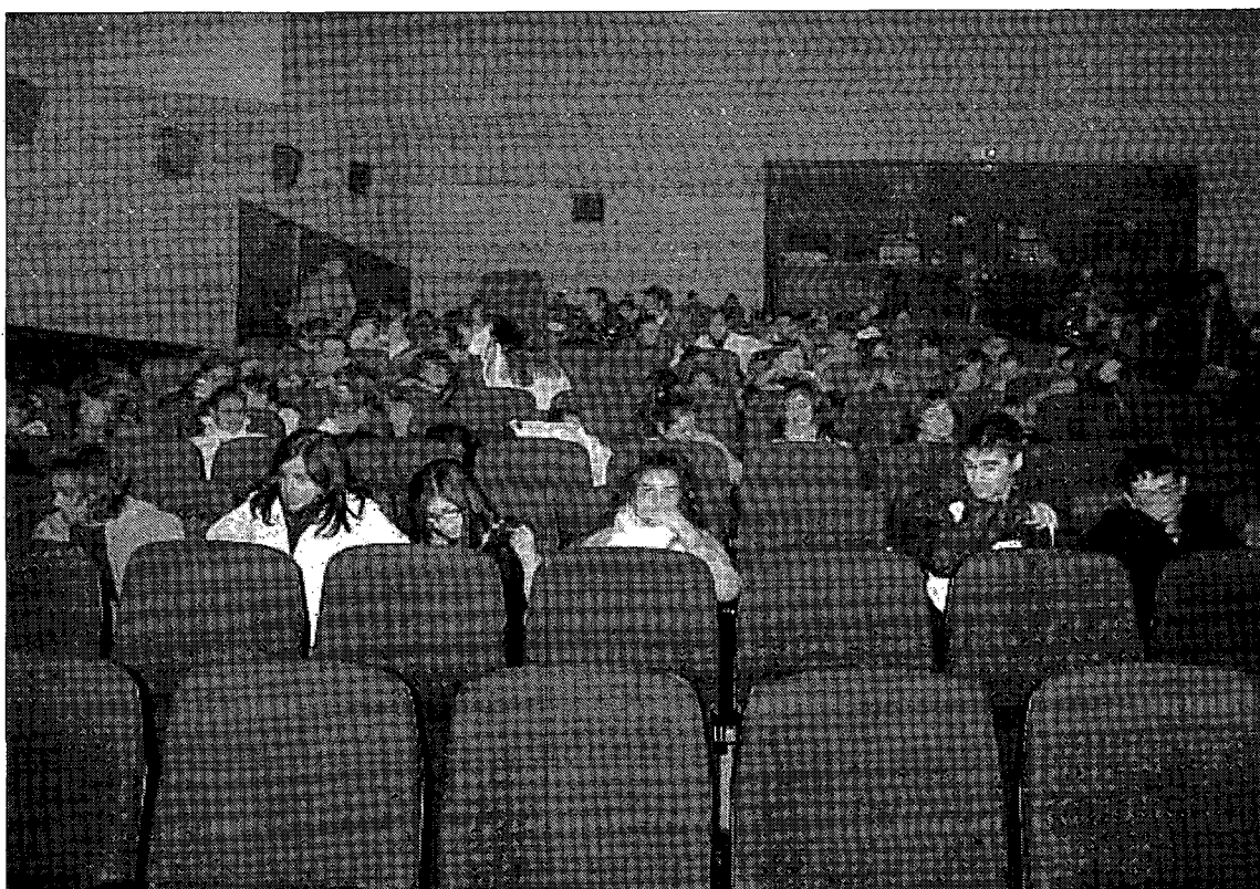
Los alumnos escucharon la charla con interés.

Por ello, su asociación no busca reabrir heridas, aseguró, sino todo lo contrario, debido a que una vez concluida la Guerra Civil tan sólo un bando tuvo la oportunidad de rendir un funeral honorable a sus difuntos por esta causa.