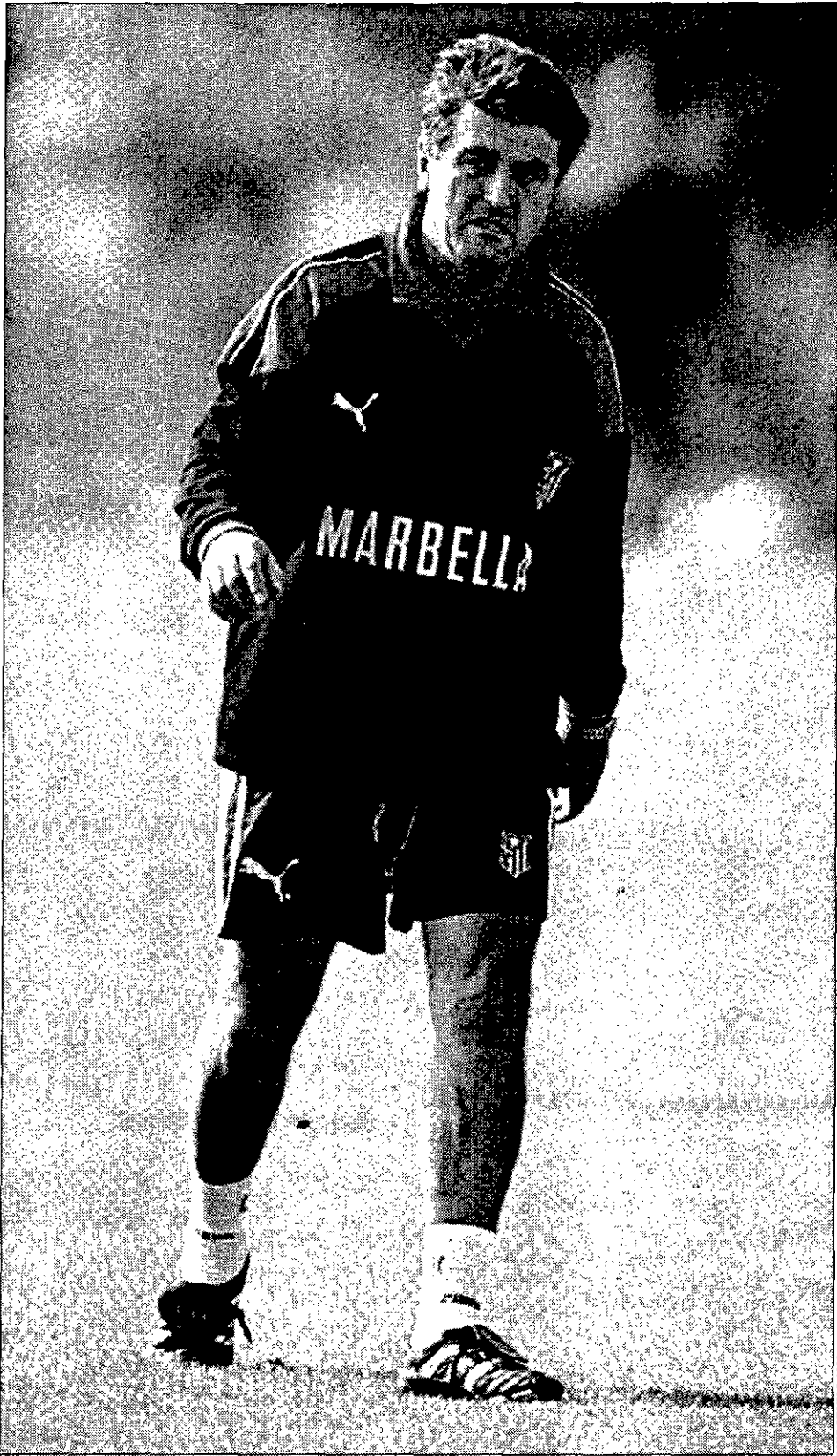
CAUTELOSO Radomir Antic no se fía del mal momento por el que atraviesa el Valencia.

El entrenador rojiblanco argumentó su decisión en la presencia de hombres como José Mari o Pantic en la convocatoria, "que pueden ofrecer alternativas válidas en un momento dado", explicó. Junto a Futre quedaron fuera de la convocatoria el sancionado Prodan y los lesionados López y Vieri. Este último se encuentra en la fase final de su recuperación, y la próxima semana se reincorporará a los entrenamientos.