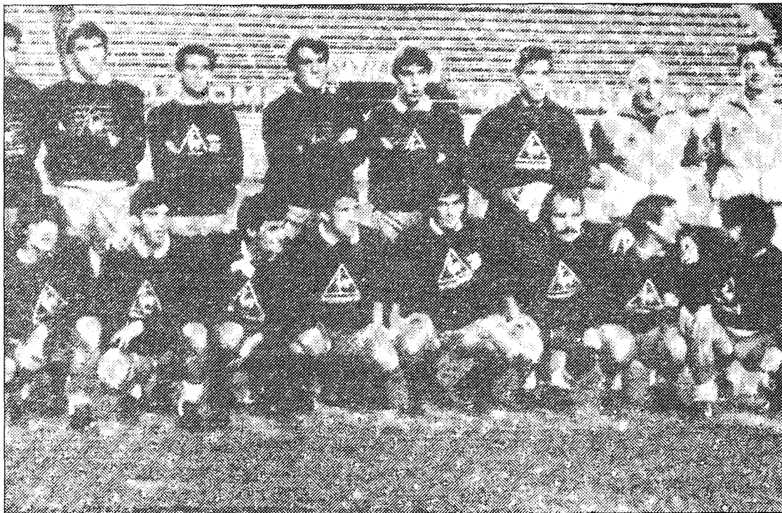
La selección española ha tenido suerte en el sorteo que se celebró en Zurich.

Ciento once naciones, de las que 33 son europeas, diez suramericanas, veinticuatro africanas, veinticinco asiáticas, quince de la Confederación Norte, Centroamericana y del Caribe y cuatro oceánicas, más Israel, entraron en los bombos de la fortuna. En el Mundial de España fueron 109 las selecciones que iniciaron el torneo clasificatorio y en el pasado de México, 121, el mayor número registrado hasta la fecha.