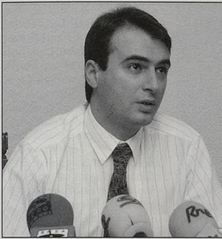
El PSOE va a enviar 25.000 cartas denunciando la campaña de desprestigio del PP.