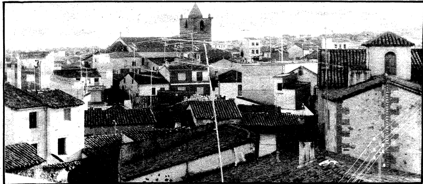
Vista general de Navalcán.