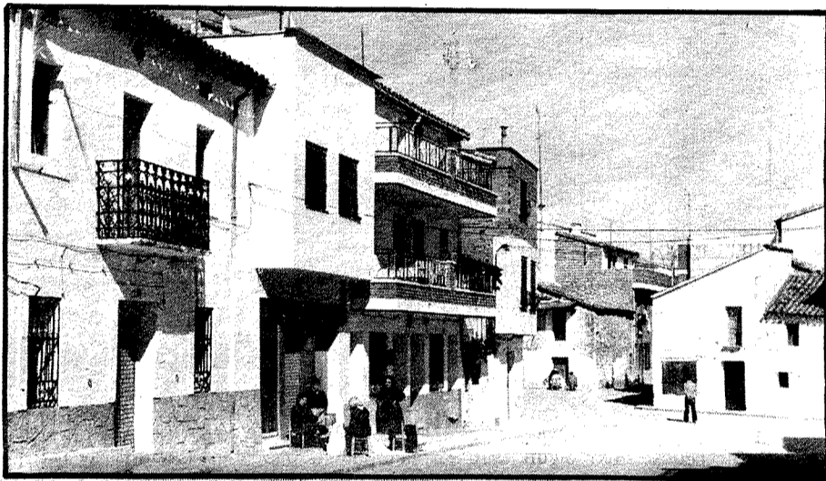
Vista parcial de la plaza.