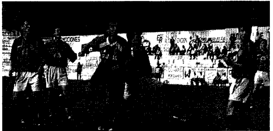
El Piedrabuena luchó durante todo el partido y se llevó un punto que ni ellos imaginaban con el 2-0.