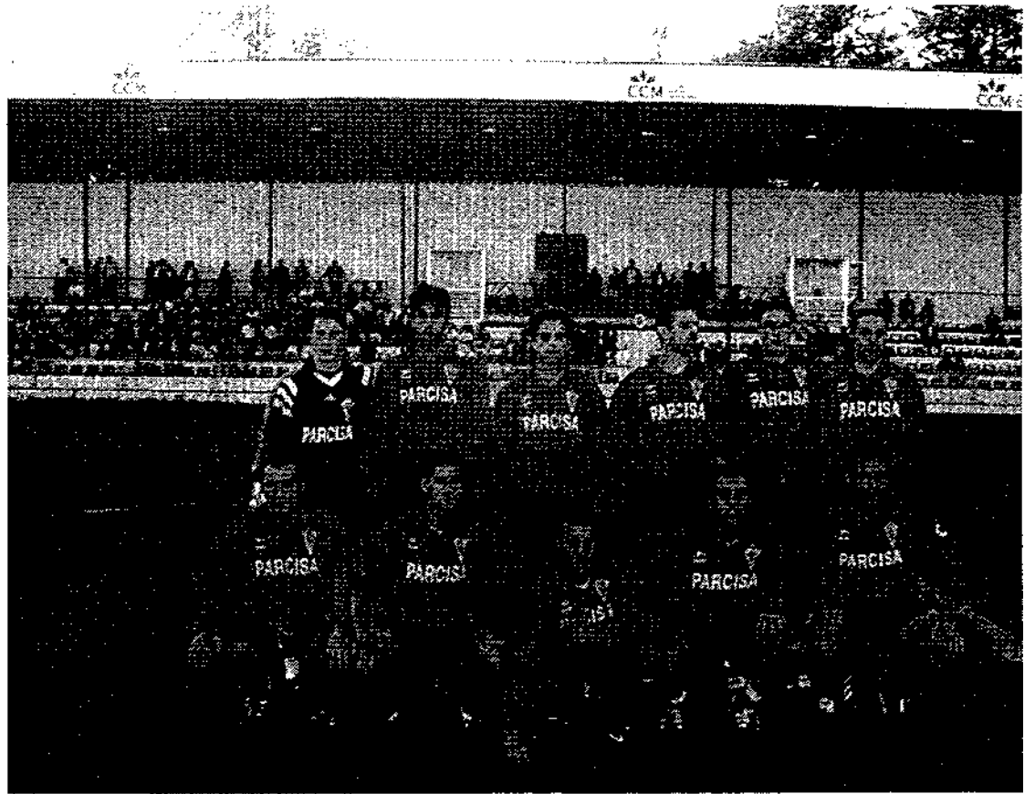
Equipo del C.P. Villarrobledo que parece que atraviesa una mala racha de juego y resultados.

En definitiva, empate del Villarrobledo que esperemos que no tengan que acordarse de ellos, por su falta de ambición.