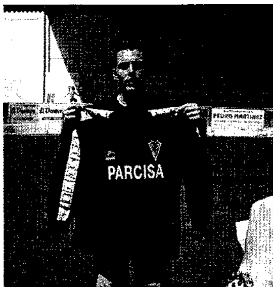
Galilea, recibió dos goles en los que no pudo hacer nada.