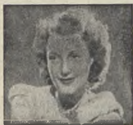
METRO GOLDWING MAYER

Llegamos al segundo punto que nos ha pedido la Revista. Nuestro anhelo es la perfección de este engraje con camaradas capacitadas para saber distinguir lo aprovechable de lo superfluo, saber dar vida a un acto