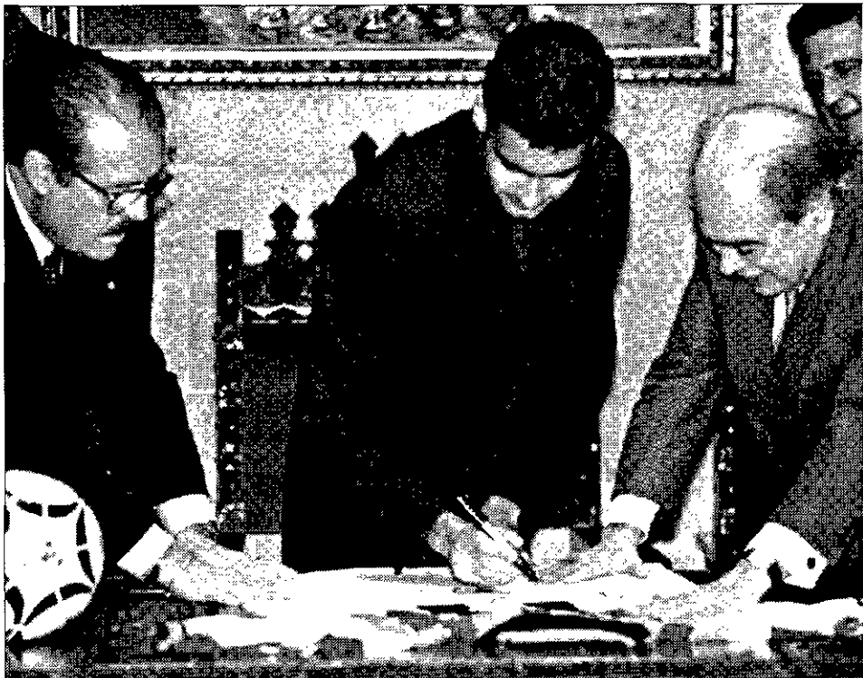
Guardiola, con Cataluña

El internacional francés no esperó un minuto para abandonar la disciplina azulgrana sin despedirse de nadie personalmente, aunque dejó una carta a sus compañeros en el vestuario para explicarles las razones de su marcha. La operación está pendiente de que el club francés ingrese en la cuenta del Barcelona 750 millones de