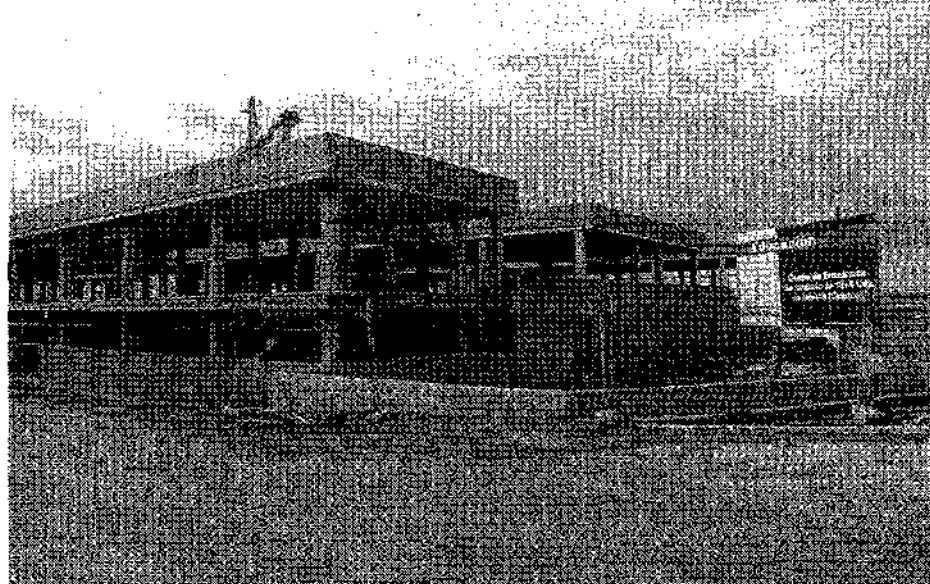
MANUEL M. CASADO

Imagen de los solares en donde, dentro de unos meses, los iniestenses verán construidos la guardería municipal (izq.) y el Instituto de Enseñanza Secundaria (dcha).