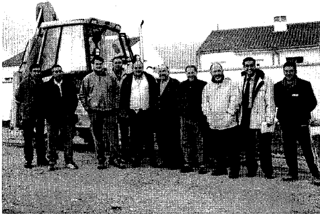
Representantes de municipios de la mancomunidad junto a la nueva máquina en Ledaña

El fin de esta mancomunidad es el arreglo y conservación de los caminos rurales existentes en los municipios anteriormente mencionados. A lo largo de los 10 años de funcionamiento de esta mancomunidad y el servicio prestado se han acondicionado cientos de kilómetros de caminos rurales que ayudan y suponen una mejora en la comunicación entre parcelas sobre todo para los agricultores.