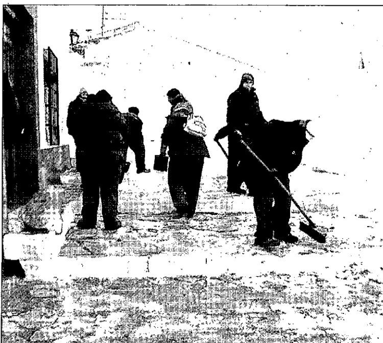
Una de las cuadrillas de limpieza en el barrio del Albáicín.

Pese a la dificultad que están provocando las nuevas heladas en estas tareas de limpieza, de momento, las calles ya han sido despejadas pero aún así se mantendrán los equipos de limpieza en algunas zonas como el barrio del Albáicín, los caminos rurales o los accesos a la población.