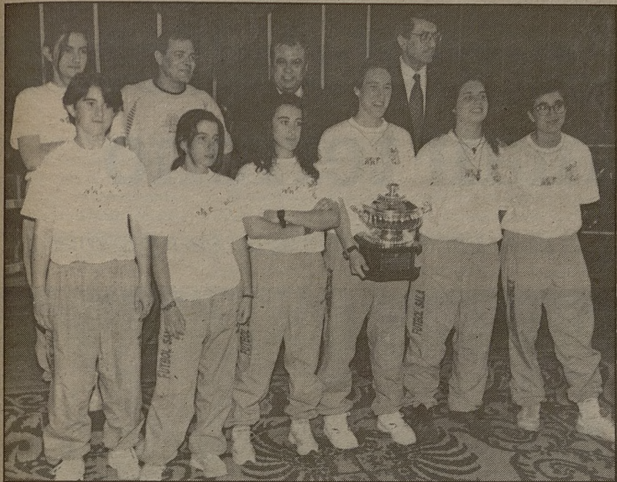
El fútbol sala femenino vivió su año de mayor prestigio y éxito gracias al Trocadero FS

firmer es sin duda, el de posibilitar su práctica en instalaciones adecuadas y asequibles. La creación de infraestructuras deportivas ha sido una constante en la política de las distintas administraciones públicas, que en los últimos años han realizado inversiones millonarias, no siempre al gusto de todos.