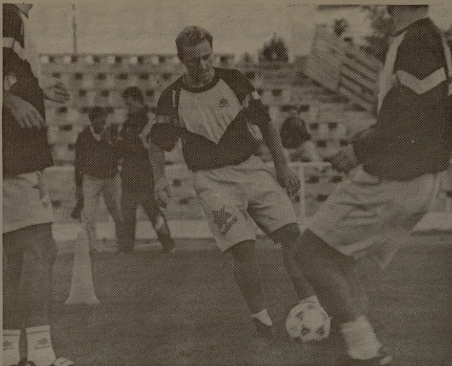
De momento el "Carlos Belmonte" no se va a remodelar. La corporación no lo considera prioritario.

Albacete cuenta en esos momentos con dos pabellones cubiertos, a los que hay que sumar los concertados en distintos centros, concretamente en muchos colegios, con el Ministerio de Educación, de tal manera que sus pistas polideportivas se pueden utilizar en horario extraescolares por los habitantes de los distintos barrios en los que se ubican. "Sacamos mucho rendimiento a las instalaciones deportivas, porque el tener instalaciones de este tipo cerradas es una inversión nefasta", señala el concejal de Deportes.