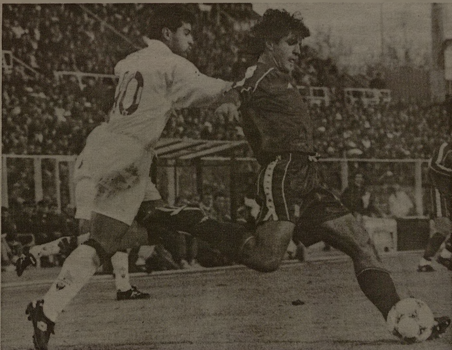
Algunos jugadores del Albacete sub-19 han conseguido pasar al primer equipo.

Otros deportes, ya minoritarios, pero que cuenta con representación en la capital manchega con el fútbol-sala, el tenis de mesa o el rugby, por citar los más relevantes.