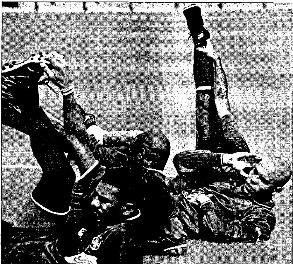
LOS FAVORITOS Ronaldo y sus compañeros brasileños parten con el cartel de máximos candidatos al título.