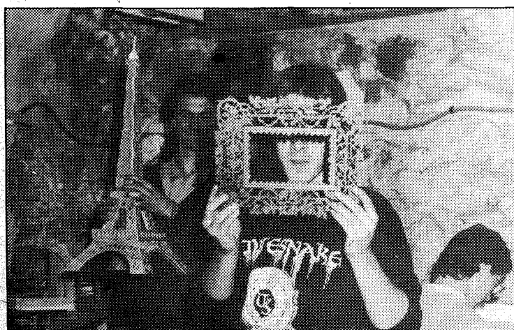
Dos jóvenes muestran sus trabajos realizados en madera