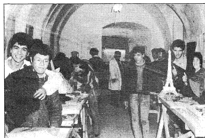
El taller actual fueron unas caballerizas del S.XVI