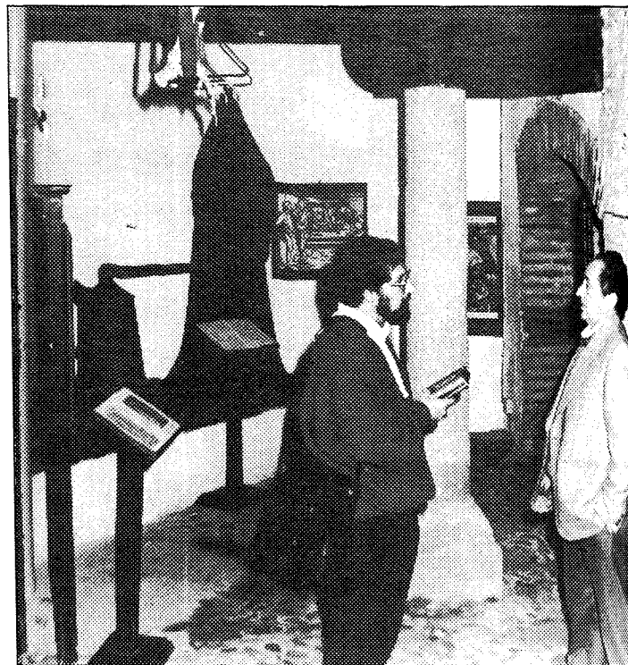
La charla discurre en las mazmorras debajo de un incrédulo despellejado.