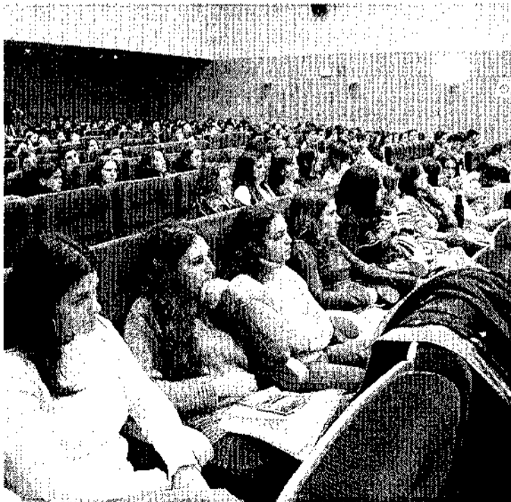
Público asistente a la I Semana Europea de Ciencia y Tecnología.

Bono aseguró a los jóvenes que el Gobierno regional está apoyando la investigación a través de becas y subvenciones y les emplazó a sacar provecho de todo ello.