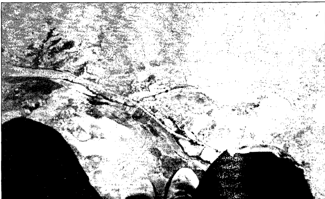
La imagen de Suby Lutolf nos muestra un pueblo de La Alcarria camino a Escamilla

El domingo 18 de octubre se clausuró el Trofeo y se entregaron los premios correspondientes a los tres primeros: 200.000 pesetas y trofeo; 100.000 pesetas y trofeo; 100.000 pesetas y trofeo, respectivamente.