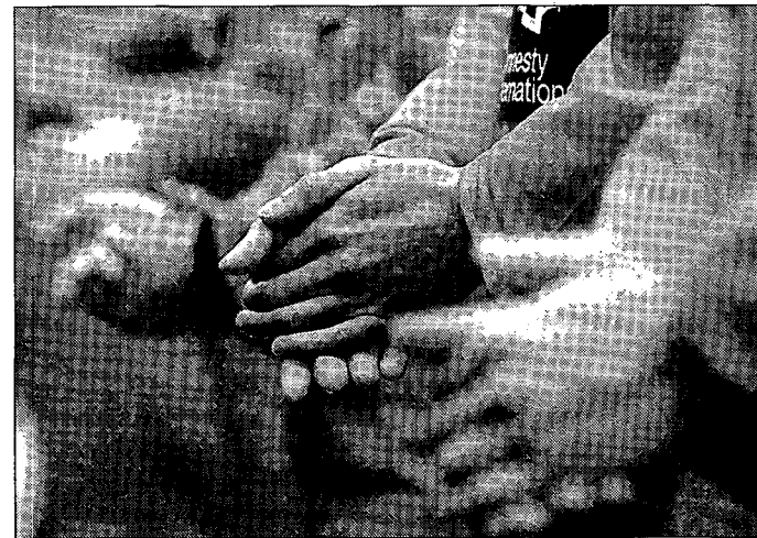
Centenares de presos están encarcelados en Guantánamo.

Sea como fuere, Washington ha pedido garantías a Londres que prueben que los presos no suponen ninguna amenaza para la seguridad.