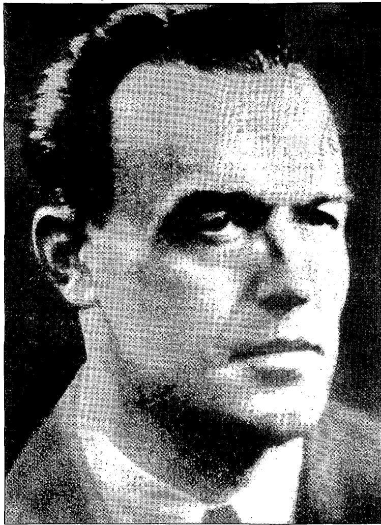
Aribert Heim, uno de los nazis más buscados, podría residir en España.

Otro de los criminales más buscados por el Mosad, el médico Joseph Mengele, conocido como el Ángel de la muerte por sus experimentos con reclusos hebreos y gitanos en Auschwitz, murió en Brasil después de refugiarse durante años en Paraguay.