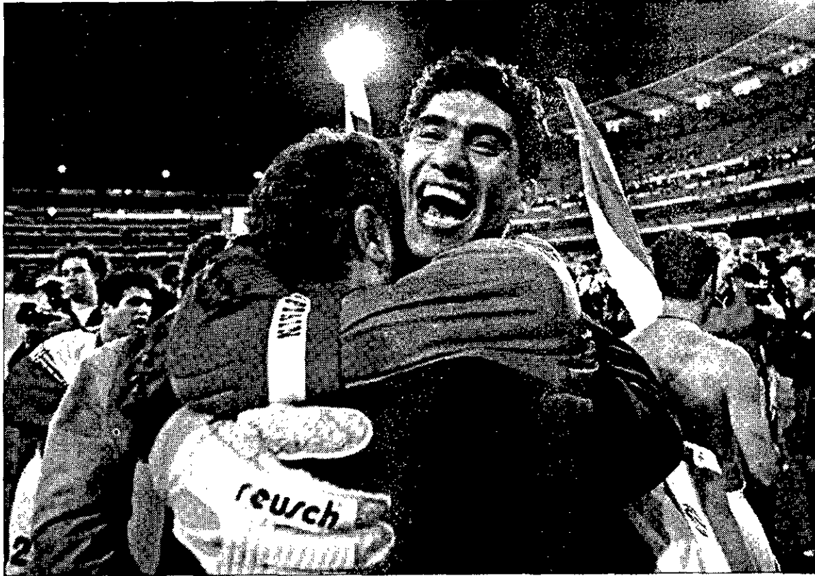
LA ÚLTIMA Irán se clasificó sorpresivamente para el Mundial al dejar en la cuneta a Australia el pasado fin de semana.

La fase de clasificación más extensa de la historia concluyó el pasado sábado, 591 días después de su comienzo, tras necesitar 643 encuentros para seleccionar a 32 conjuntos y dejar un reguero de 106 muertos. Esta fase de clasificación batió todas las plusmarcas. Desde la participación (169 países), hasta la mayor goleada de la historia (0-17 de Irán a las Islas Maldivas). Se disputaron 643 encuentros, en los que se marcaron 1.922 goles. Un total de 106 aficionados murieron por la falta de seguridad en estadios; Diez en Zambia, 91 en Guatemala y 5 en Nigeria, y la inestabilidad política obligó a cuatro selecciones a jugar fuera de sus países (Albania, Zaire, Liberia y Bosnia).