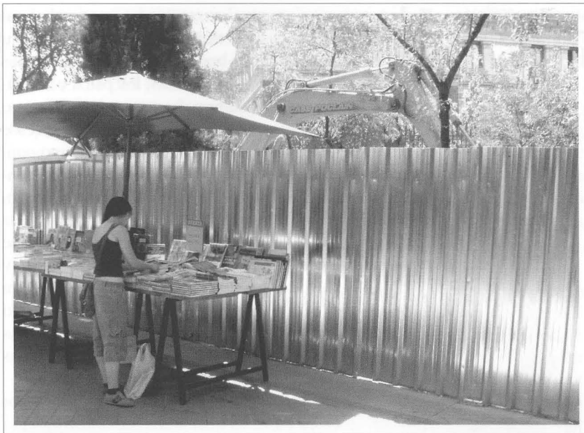
Unión Fenosa trabajará cerca de dos años en la zona