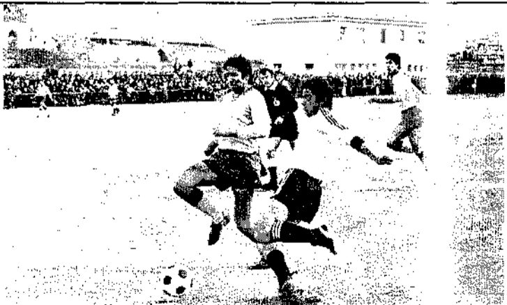
Imagen del Conquense-Alcorcón de febrero de 1981, jugado en Laplana por las obras de La Fuensanta. El que centra es el actual entrenador de la Balompédica. Estilo y...

En Tercera División se enfrentaron por vez primera el 12 de octubre de 1980 en Alcorcón (1-0) y la vuelta en La Fuensanta el 12 de febrero del 81. La última vez que jugaron ambos clubes fue el 31 de agosto de 1986, con 3-1 para el Conquense, con Esquinas Torres como árbitro, y el 11 de enero de 1987, con la primera victoria del Conquense en el "Santo Domingo" por 1-2.