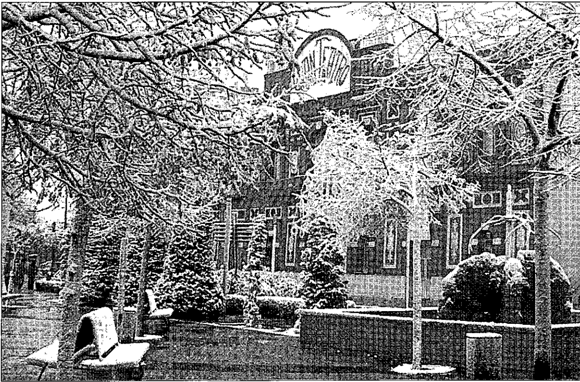
La nieve cubrió de blanco Manzanares. / LT