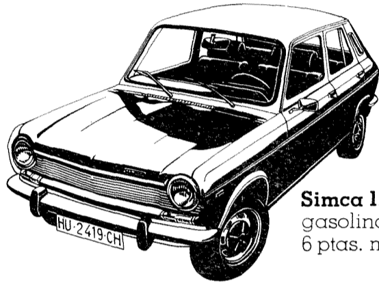
Simca 1200 LS 5 puertas: gasolina normal. 6 ptas. menos por litro.