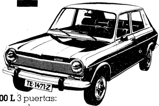
Simca 1200 L 3 puertas: gasolina normal. 6 ptas. menos por litro.