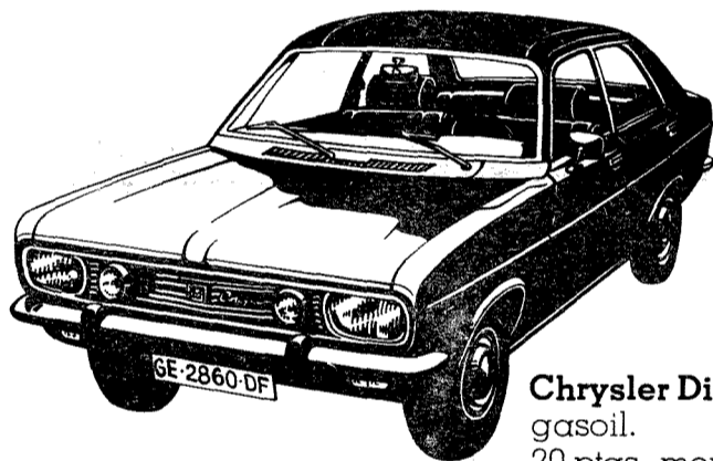
Chrysler Diesel. gasoil. 20 ptas. menos por litro.

Por cara que se ponga la gasolina, Chrysler España siempre tiene previsto el ahorro. Por eso siempre dispone de coches que no gastan gasolina, o que la gastan barata.