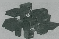
Papel, cartón, periódicos y revistas