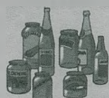
Botellas de vidrio, frascos y tarros

PODRÁS ENCONTRAR LOS CONTENEDORES EN LAS ÁREAS DE APORTACIÓN DE TU MUNICIPIO