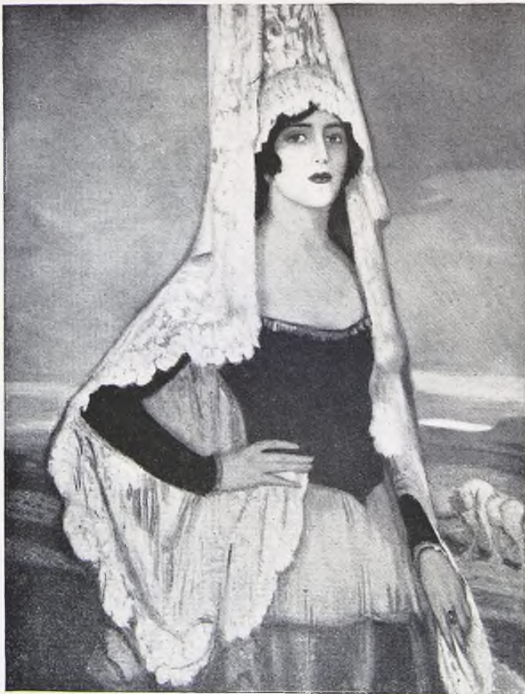
BELTRÁN MASES. La mantilla

La obra pictórica de Federico Beltrán Masés plantea una espinosa cuestión de medios y fines que es interesante dilucidar. Ya se sabe que el cuadro es el resultado convencional y efectista del equilibrio o desequilibrio, según los casos, que las cualidades y las ineptitudes del pintor ocasionan en el plano previo del trabajo artístico, determinando la localización y el ángulo del punto de vista. El pintor elige aquel camino que incluso sus propios defectos le abren—al prohibirle los rumbos de otras preferencias posibles—y que la virtud ha de orientar. La particular y unilateral posición psicológica y estética del artista representa ya a priori una exclusión rotunda de aquellas sugerencias plásticas que el tema le ofrece, pero que el pintor ha abandonado para consagrarse por completo al aspecto que decide su elección. El asunto—estímulo externo—se hace tema, es decir, reacción personal que informará y completará la obra de arte en un sentido unívoco. Tal vez no sea la inspiración otra cosa sino el momento en que un ingrediente extraño a la conciencia, pero captado por ésta—bien surgido en el mundo exterior de los sentidos, bien en el ámbito de la introspección—, se convierte en sustancia temática y, por lo tanto, en fuerza que impulsa a la realización del cuadro.