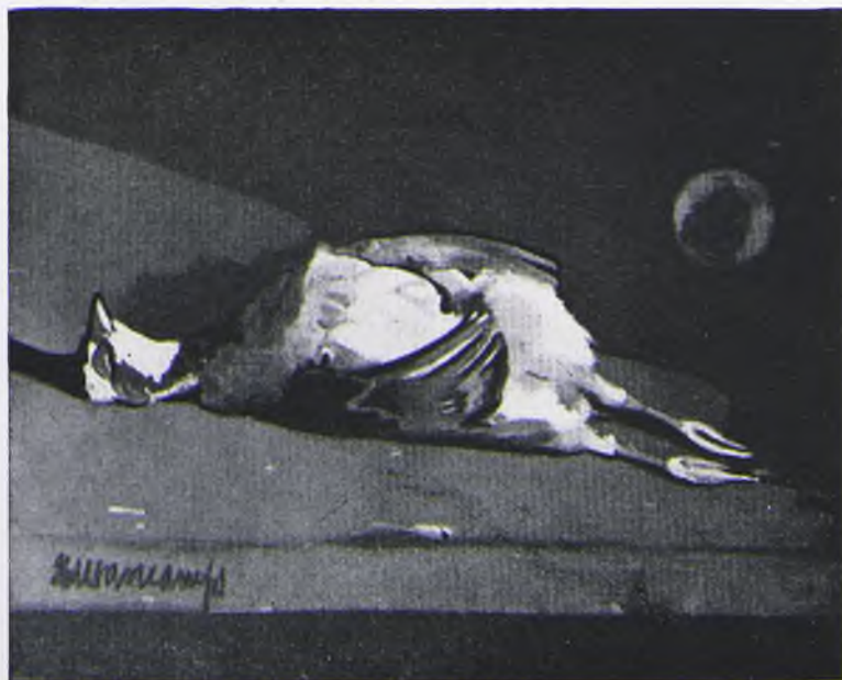
DURANCAMPS. La perdiz

Federico Beltrán Masés no es un pintor de receta. Su estilo es una sucesión de fórmulas; pero no un sistema de pactos claudicantes entre la técnica y el problema. Un fallo en el uso de las reglas del pintar—de la técnica—engendra una forzosa renuncia del artista a los itinerarios estéticos que su defecto le veda. Cuando un pintor sabe adaptar y perfeccionar aquel orden de creación.