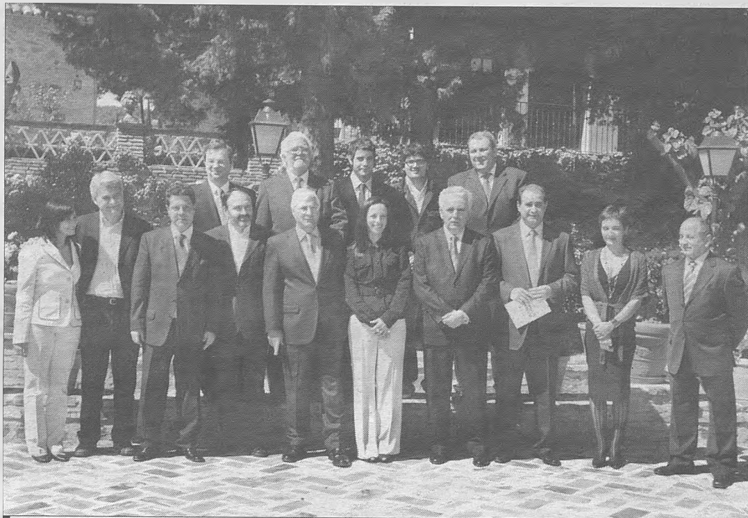
El presidente de Castilla-La Mancha, José María Barreda, y la ministra de la Vivienda, Beatriz Corredor, presidieron la firma del Pacto por la Vivienda de Castilla-La Mancha, en Toledo. En la imagen, posan con los agentes sociales y empresariales de la región que firmaron el pacto.

moción privadas realizadas sobre suelos de titularidad privada, en lugares en los que exista demanda, para las que se pacta un precio que las haga asequibles y, a su vez, atractivas en términos de costes de construcción y rentabilidad.