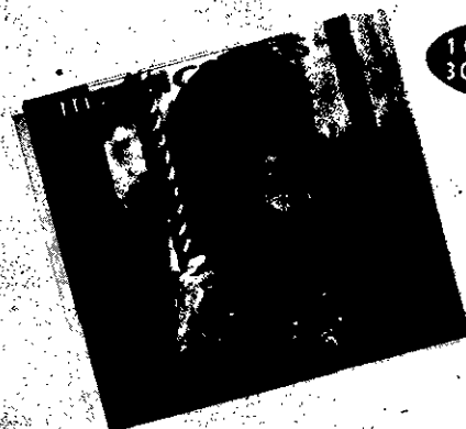
Maria Callas "The great Maria Callas"