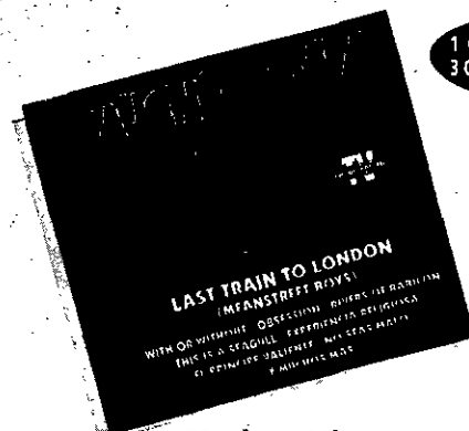
Mucho + Mix "Varios"