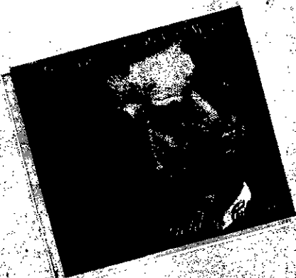
Giuseppe Verdi - Richard Wagner "Golden Classics"