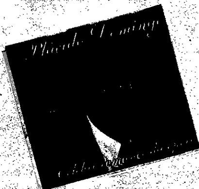
Plácido Domingo "Celebri romance da opere"