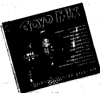
Goyo Mix "Desparrame Total"