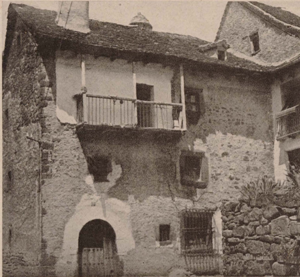
Casa en Ansó. "El balcón tiene acceso desde la gran sala, y está siempre en el último piso..."

los pares, que van enlazados a media madera, sin caballete, en la lima. Si los pares son muy largos apoyan a media longitud, en las selvas, piezas horizontales, que cuando son muy largas están formadas por dos empalmadas a media madera. El empalme apoya sobre las tijeras.