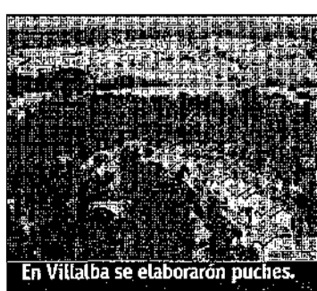
En Villalba se elaboraron puches.

El último acto de Campicultura 2001 tendrá lugar el 1 de diciembre, día en el que se recreará una tradicional matanza más el proceso realizado para preparar los productos derivados. Además, habrá gachas de matazón.