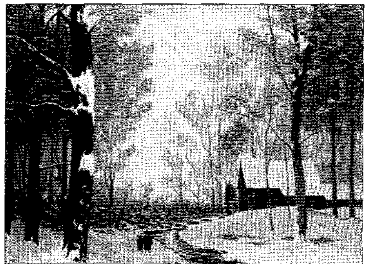
Los cuentos versarán sobre el tema genérico de la Navidad.