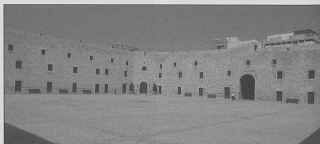
Patio de armas del castillo de Santa Pola