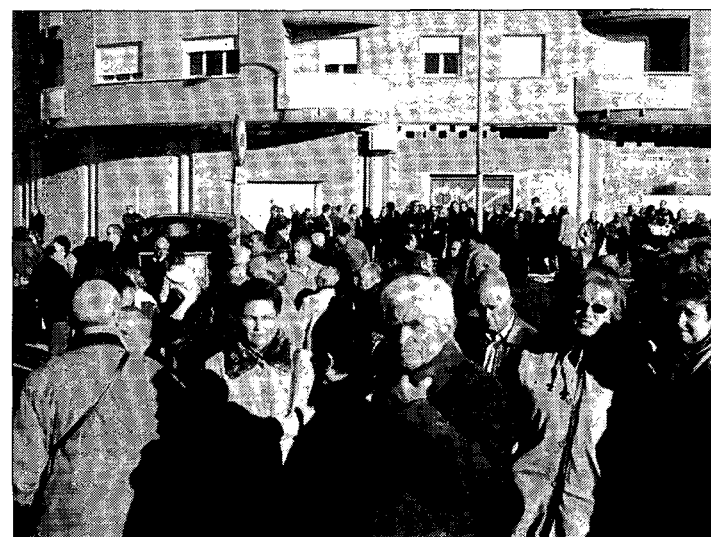
Cientos de agricultores asistieron a la inauguración.