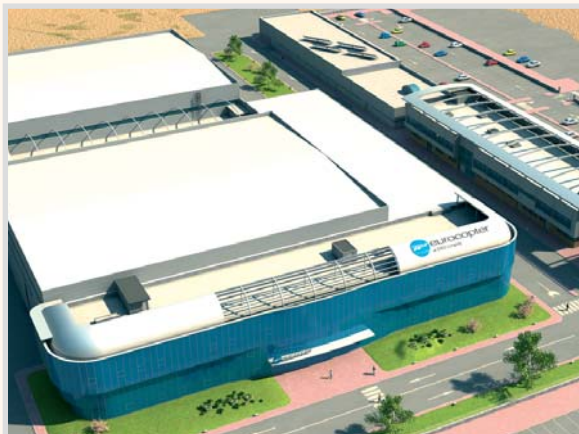
Recreación virtual de Eurocopter.

Para los pacifistas de manual no será un consuelo saber, porque lo saben, que si la fábrica no estuviera aquí, estaría en Madrid, Sevilla o Zaragoza. Hubo